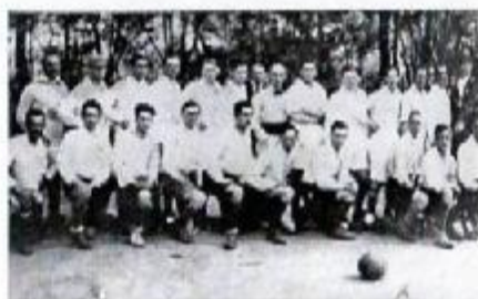
Futbalové mužstvo Fraštackého športového klubu (FŠK) Hlohovec r. 1919