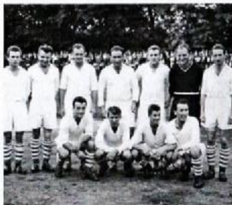
Slovan Hlohovec pred zápasom s ŠK Slovanom Bratislava r. 1957