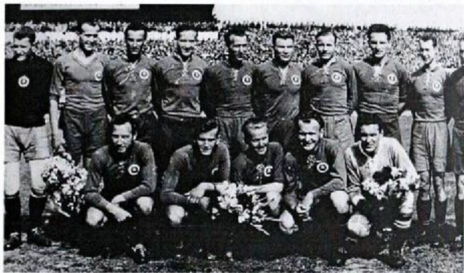
ŠK Slovan pred zápasom so Sláviou Praha r. 1945.

Rodák z Hlohovca sa narodil 26. marca 1925. Ako väčšina ľudí z tohto okolia hovoril tvrdo, bernolákovčinu by vari nezradil za nič na svete. Rovnako ani svoju najväčšiu lásku futbal, ktorý miloval a možno by neprežil a sa červenal, keby ho mal oklamať. Bol známy svojimi riekankami. Stali sa šľahačkou na futbalo-