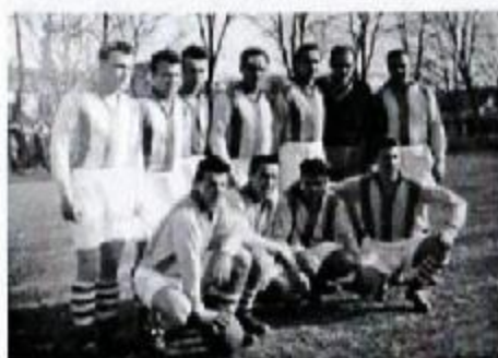
Futbalová jedentáska Slovana Hlohovec pred ligovým zápasom