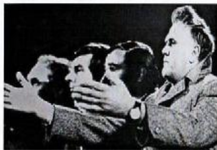
Na trénerskej lavičke

Svoju ctížiadosť a húževnatosť umocňoval i na trénerskom poli. Na rozdiel od mnohých iných neskočil rovno do I. ligy, ale toto remeslo si vyskúšal od piky. Začínal v Slavoji Piešťany, odkiaľ sa vrátil na Tehelné pole k rezerve. Ďalšia jeho púť viedla do Iskry Holič, ďalej do Slovana Galanta, Elektrovitu Nové Zámky, TŽ Třinec a odtiaľ definitívne do veľkého futbalu. Na ligovej scéne upútal jedinečným spôsobom. Premiéru v Trenčine začal vo veľkom štýle. S Jednotou vyhral