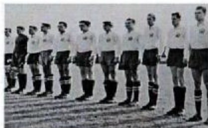
V belasom drese Slovana Bratislava pred zápasom s CDKSA Moskou v r. 1947.