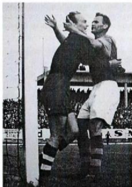
Z ligového súboja v r. 1956