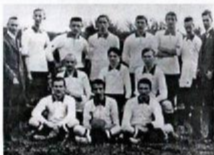
Prvé futbalové mužstvo GAC Hlohovec roku 1914

Klub dostal i nové ihrisko pri nádraží, na ktorom sa započala slávna éra hlohovského futbalu. Mužstvo dosahovalo