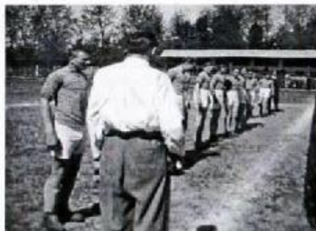
Pred zápasom na starom futbalovom štadióne pod kláštrom