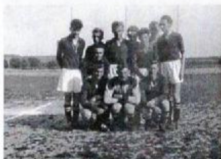
Hlohovskí futbalisti na starom štadióne