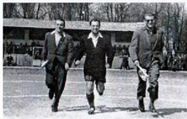
Stará tribína futbalového štadiónu v Hlohovci

Jeho trénerská kariéra bola podrobne opísaná mnohými komentátormi a športovcami, no dôležité je aj pripo-